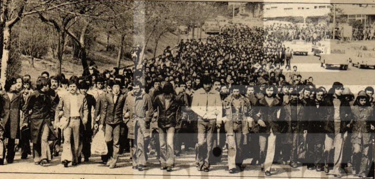
İTÜ öğrencilerinin, faşist işgali protesto yürüyüşü

Üçlü Blokun ve bütün maceracıların ortak özelliği gençlik kitlelerine karşı güvensizlikti. On